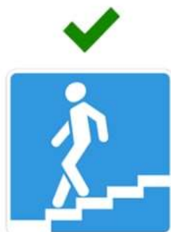
Подземный пешеходный переход